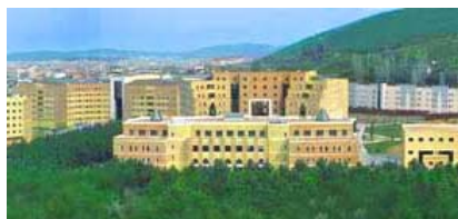
Universidad YEDITEPE Estambul, Turquía